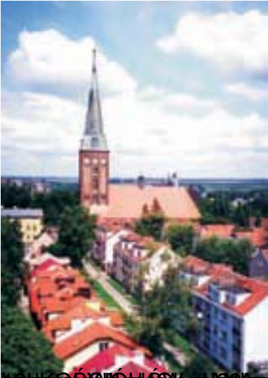
Widok z góry na Stargard, Klejnot Pomorza, szlak staromiejski