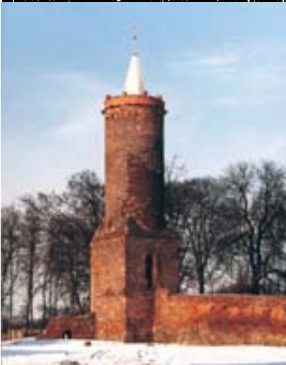
Wieża Stargardzka, Klejnot Pomorza, szlak staromiejski