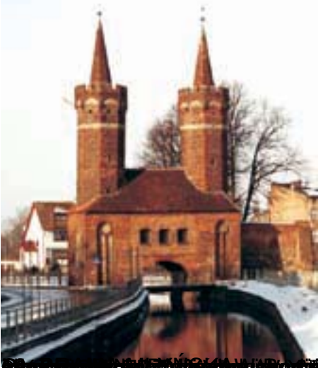
Brama Stargardzka, Klejnot Pomorza, szlak staromiejski