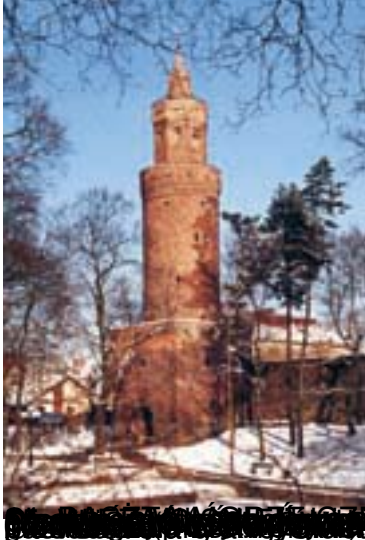
Wieża Dzwonowa - siedziba Muzeum Regionalnego w Stargardzie. Wybudowana w 1860 roku, wzniesiona z cegły, posiadała 6000 litrów wody.