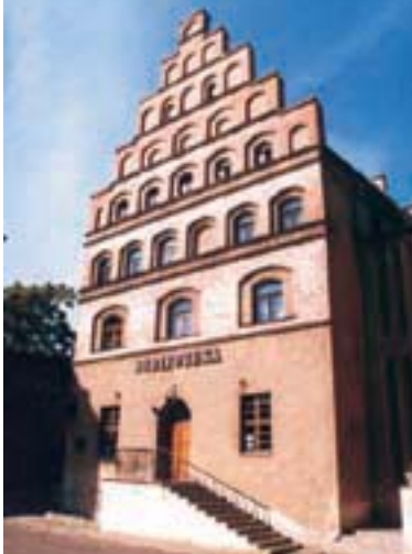
Ratusz Starego Miasta - siedziba Urzędu Miejskiego. Obiekt w budowie w latach 1945-46. Siedziba